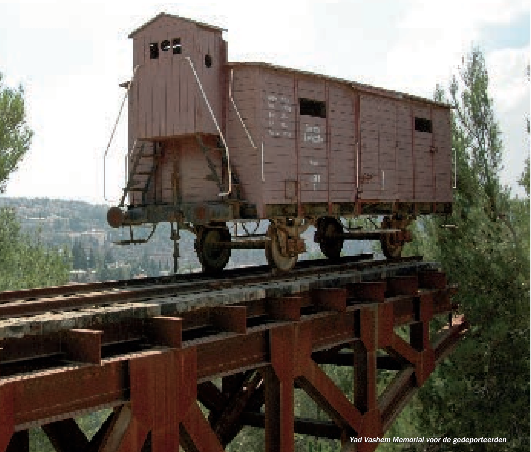
Yad Vashem Memorial voor de gedeporteerden